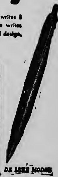
DE LEKE MOEDER

No more ink-stained clothes from leaky pens